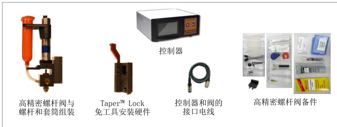
图 1: 高精密螺杆阀整合套件

高精密螺杆阀配上本公司的专利实时稳压控制系统 (FPC)，使点胶阀的性能提升到更高水准。实时稳压控制系统是在稳定点胶工艺上的新突破。无论胶管大小或任何胶位，它确保稳定胶水供应给点胶阀。FPC监视进入点胶阀的胶水压力，同时进行胶管压力调整以确保胶水稳定的进入点胶阀。更多详细资料，请在GPD Global 网页上参阅 实时稳压控制系统 (FPC) 。