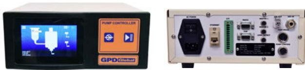
图2：控制器前后视图

阀的控制参数有加速度，减速度，旋转速度和旋转量（仅用于点）。控制器上的触摸屏非常直观，透过通用的符号，图片或数字进行编程。该控制器也可以连接到电脑上进行远程编程，使这个综合控制器可以满足所有精密螺杆阀的需求。客户可以独立设置不同的参数，通过系统的输入引用。图3解说如何把螺杆阀整合到第三方的点胶系统上。