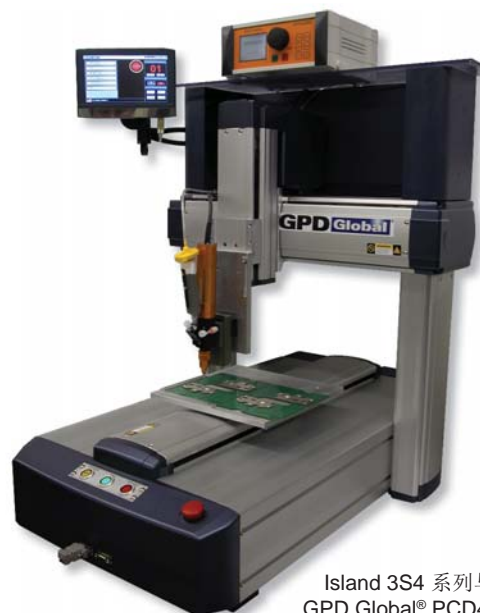
Island 3S4 系列与 GPD Global® PCD4 阀

启动程序可按下系统正面的启动按钮，或在触摸屏上按循环。为了方便循环计数和批次，该系统可以设置运行的一定数量单位，然后在循环结束，通知操作员。